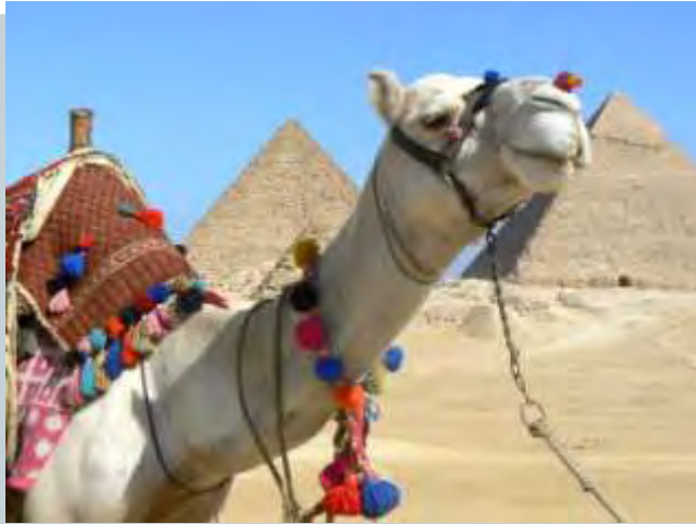
Die Pyramiden von Gizeh