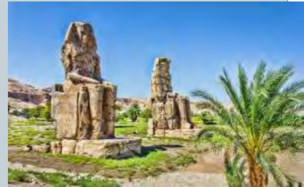
Luxor Tal der Könige