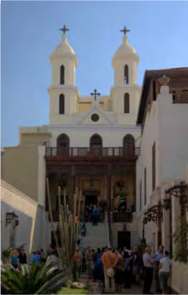
Die Hängende Kirche, Alt-Kairo

Die koptische Kirche ist die christliche altorientalische Kirche Ägyptens mit je nach Quelle 5 bis 11 Millionen Gläubigen in Ägypten. Darüber hinaus gibt es kleine koptische Gemeinden in Libyen, im Sudan und einigen anderen Ländern. Der koptisch-orthodoxen Kirche steht ein Papst vor, seit 2012 Tawadros II