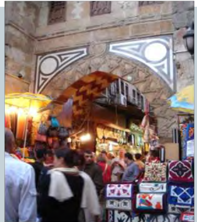
Khan Khalili, Kairo